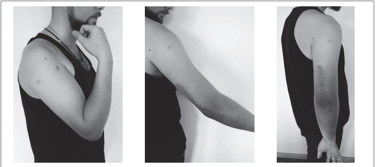
Рисунок 1. Фото хворого С., карта стаціонарного хворого № 1990, 27 років. Травма 12.02.17. Закритий осколковий перелом нижньої третини правої плечової кістки зі зсувом. 15.02.17 р. здійснено закритий блокований ретроградний інтрамедулярний МОС перелому нижньої третини правої плечової кістки. Функція через 6 тижнів

вне навантаження дозволяли з 12–14-го тижня після операції.